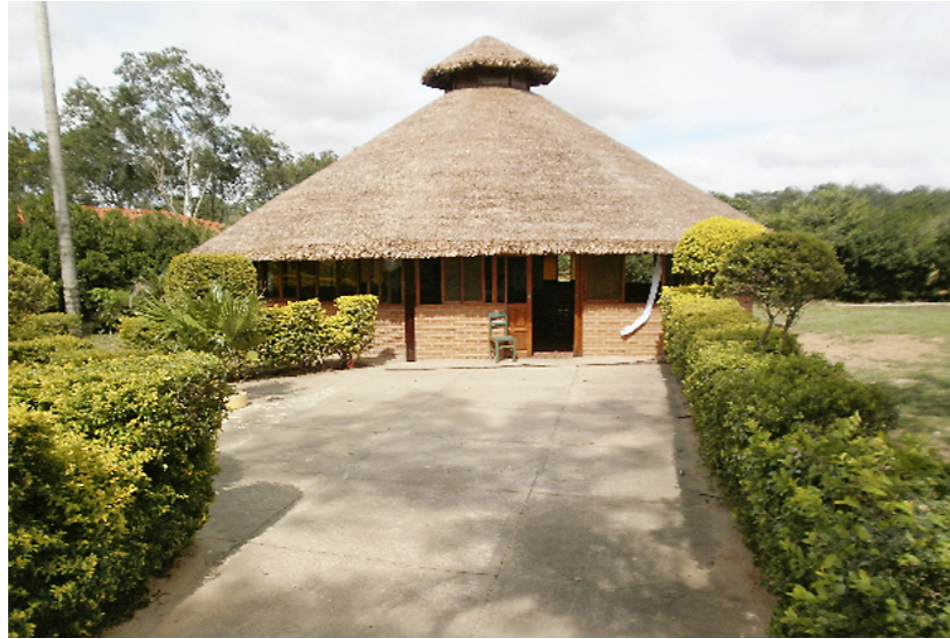
Die Kapelle mit neuem Strohdach